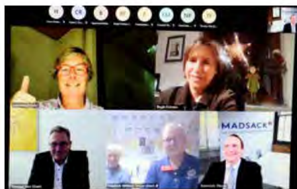
Die Siegerehrungen in Gifhorn (l.) und Wolfsburg fanden als digitale Abschlussveranstaltung statt.