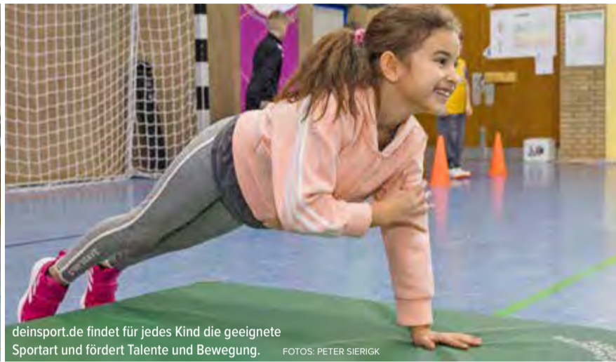
deinsport.de findet für jedes Kind die geeignete Sportart und fördert Talente und Bewegung.