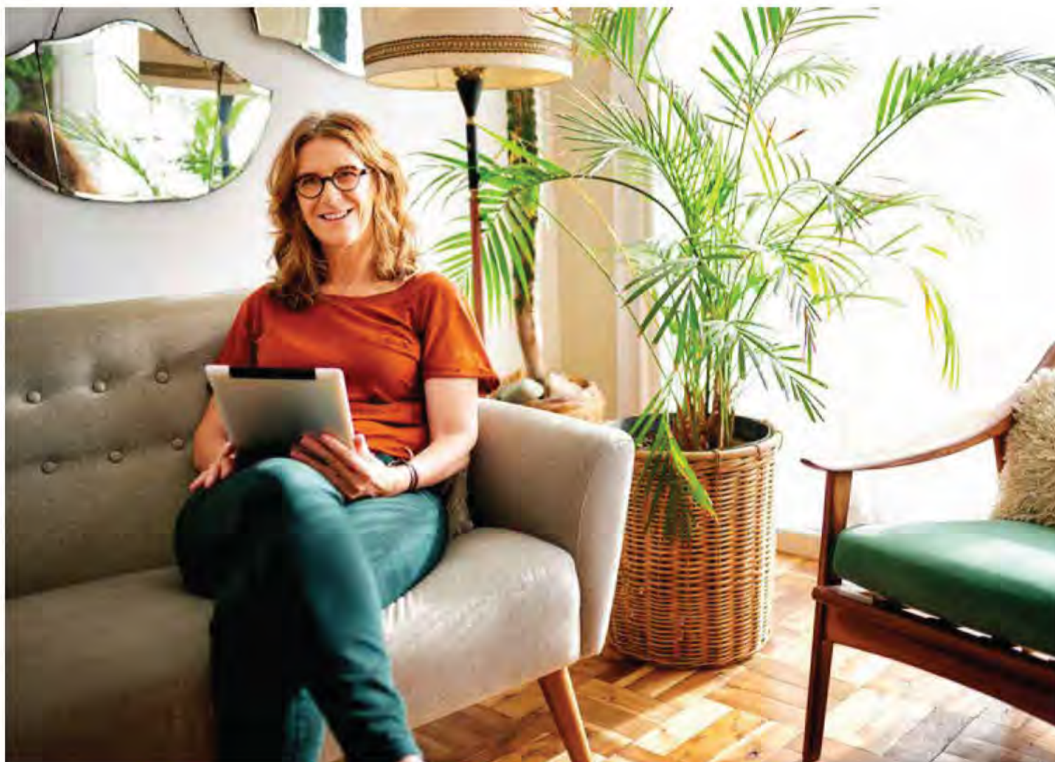
Online Wertpapiere handeln geht auch ganz einfach und bequem von zu Hause aus.

Weitere Informationen zum Online-Depot und ein Erklärvideo, wie der VR-ProfiBroker funktioniert gibt es unter www.volksbank-brawo.de/wertpapierdepot .