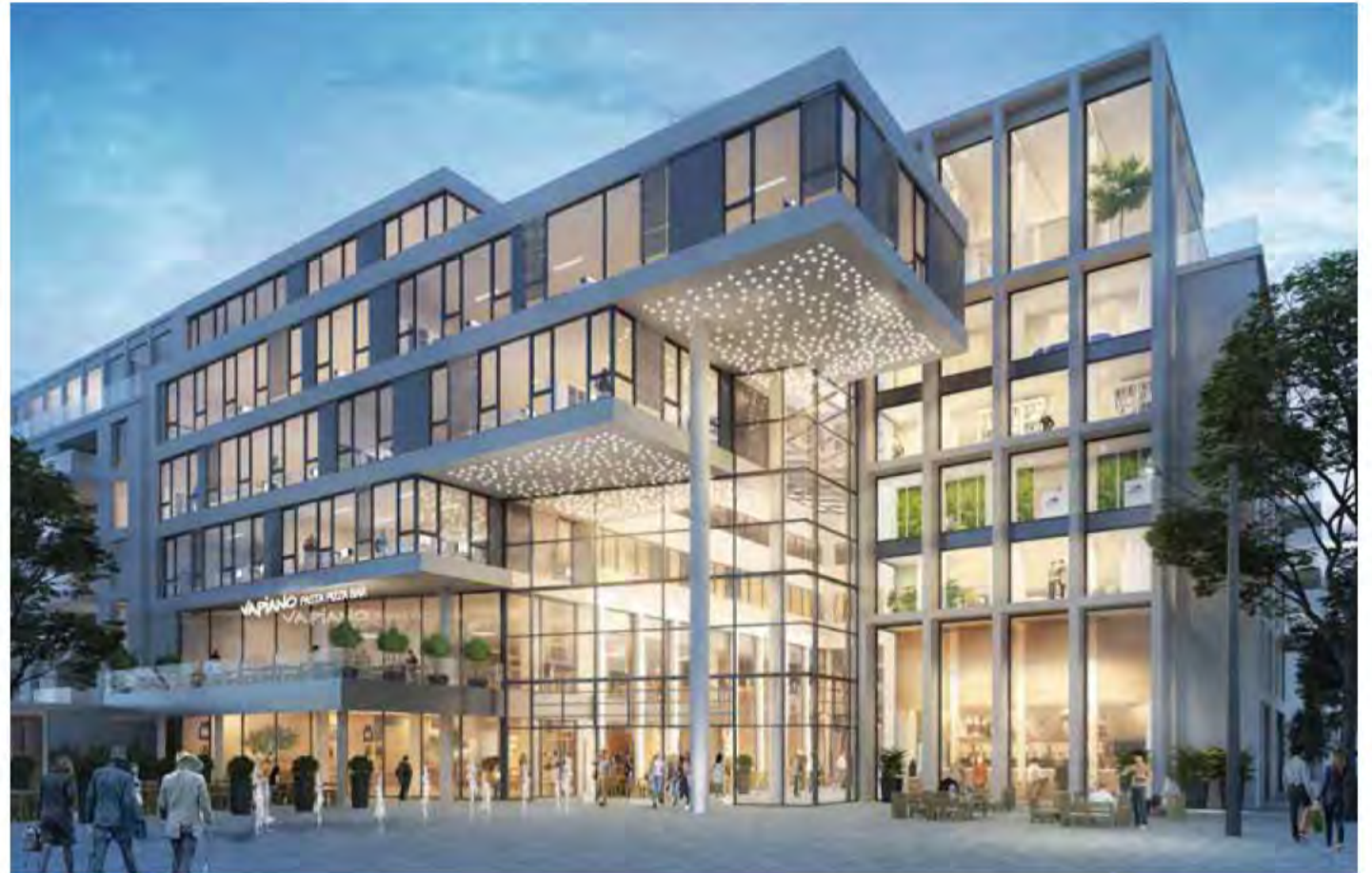
VISUALISIERUNGEN: GIESLER ARCHITEKTEN / CHORA BLAU ARCHITEKTURVISUALISIERUNG