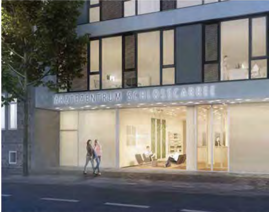
Visualisierte Darstellung des neuen Eingangs des Ärztehauses (I) und der Front des Schlosscarrees in Richtung Ritterbrunnen.

modernisiert. Dafür wird umlaufend eine mineralische Dämmung angebracht, die teils verputzt und teils mit einem vorgehängten Fassadensystem verkleidet wird. Die einzelnen Gebäude werden dabei durch verschiedene Farbnuancen differenzierbar bleiben.