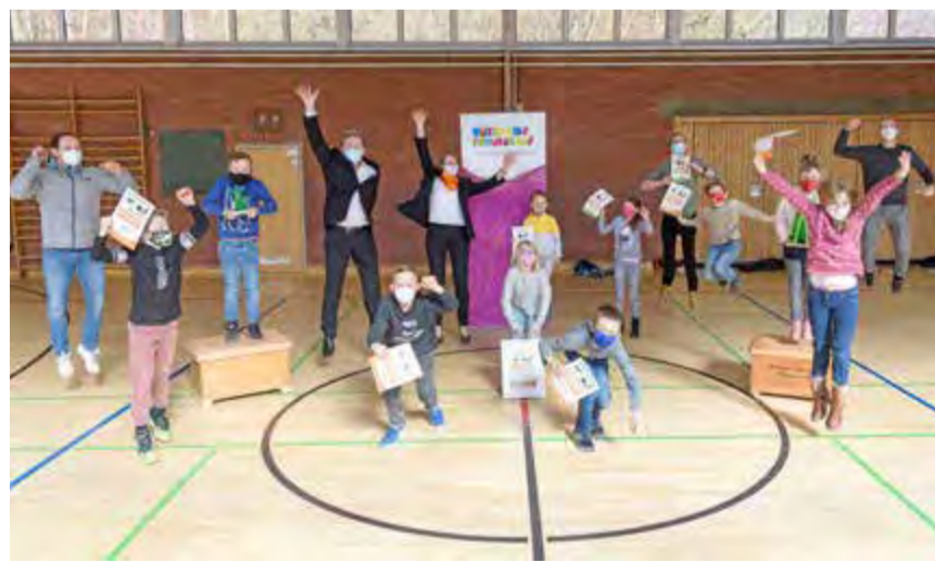
Die Klasse 3w der Grundschule Waldschule Salzgitter-Bad konnte sich über den step BraWo-Gesamtsieg im vergangenen Schuljahr freuen.

Alle weiteren Infos zu step BraWo gibt es unter www.step-brawo.de .