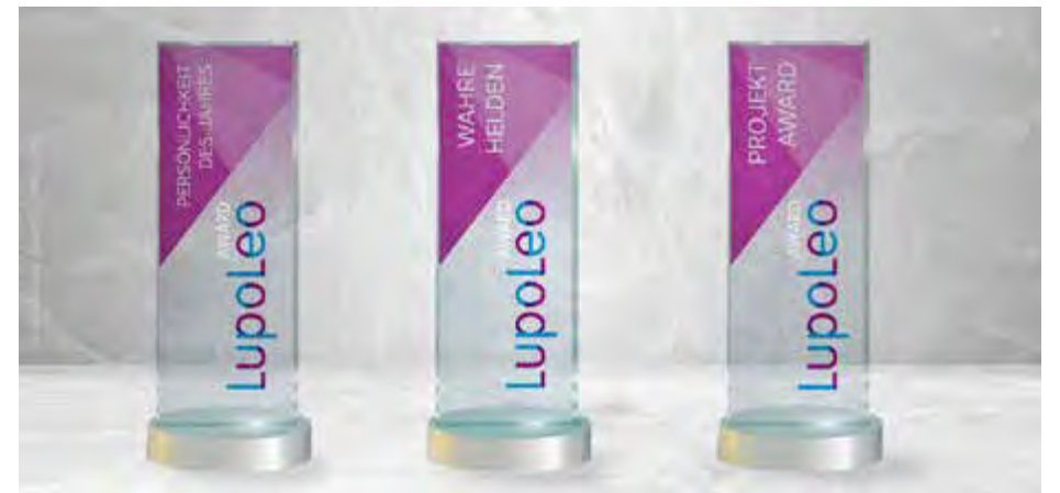
Der LupoLeo Award wird auch 2022 in den drei Kategorien „Persönlichkeit des Jahres“, „Wahre Helden“ und „Projekt Award“ vergeben.

Alle weiteren Informationen unter lupoleo.de .