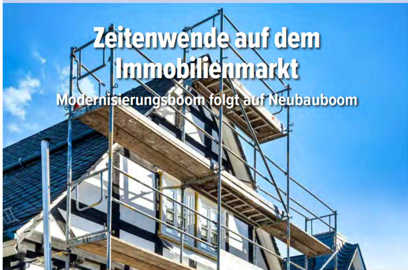
Immobilienmarkt im Wandel: Die Bestandssanierung wird aufgrund steigender Kosten beim Hauskauf immer attraktiver.