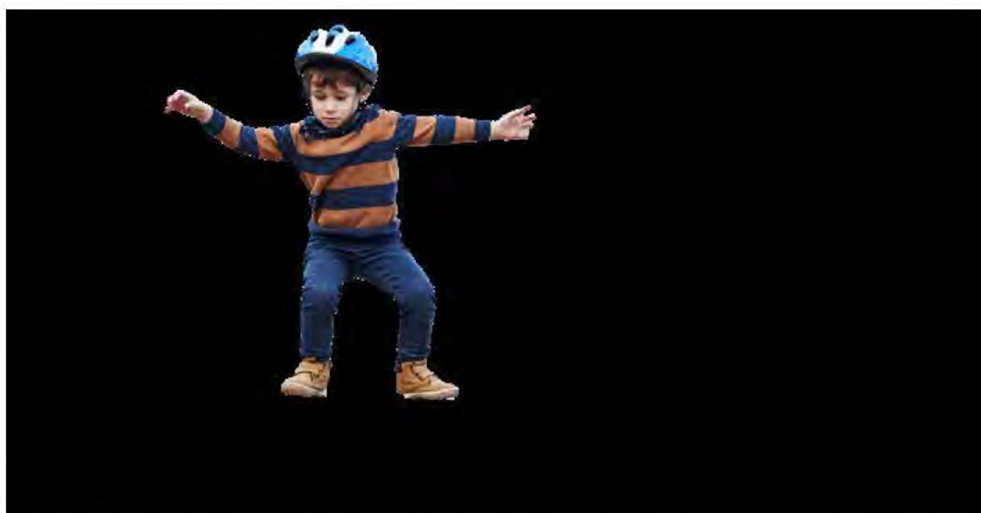
Kinder brauchen besonderen Schutz, denn viele Unfälle passieren beim Spielen. Hier hilft eine spezielle Unfallversicherung.

• Zeckenbiss und Insektenstiche: Zecken können gefährliche Krankheiten übertragen,