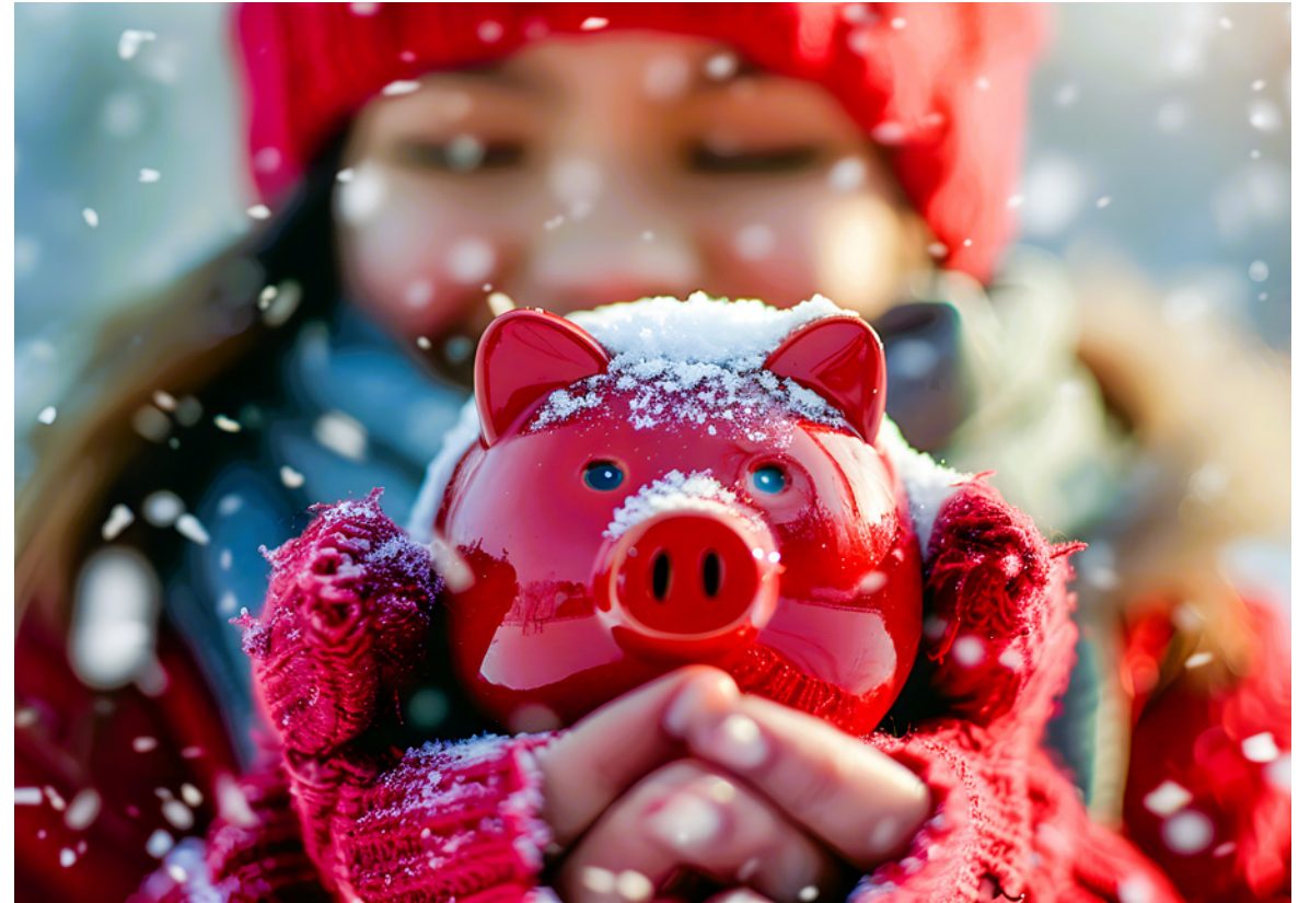
Da freut sich das Sparschwein: Vergleichen zum Jahreswechsel kann sich finanziell oft auszahlen.

Auch in Sachen Altersvorsorge sollte regelmäßig geprüft werden, ob alle Möglichkeiten von staatlichen Prämien und Zuzahlungen voll ausgeschöpft werden. Denn der Staat fördert verstärkt die private Altersvorsorge, damit der wohlverdiente Ruhestand später einmal auch finanziell abgesichert genossen werden kann.