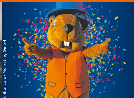
UNITED KIDS FOUNDATIONS FAMILIENTAG Sonntag, 5. Juli