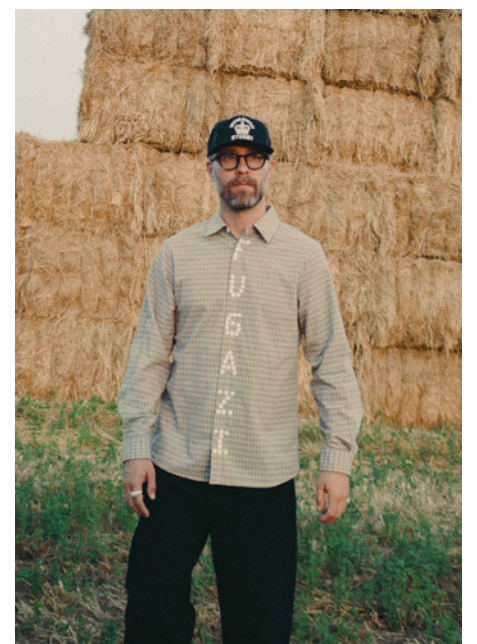
Neue Stars für die BRAWO Bühne 2026: Roy Bianco & Die Abbrunzati Boys (Mitte), SDP (links) und Mark Forster.