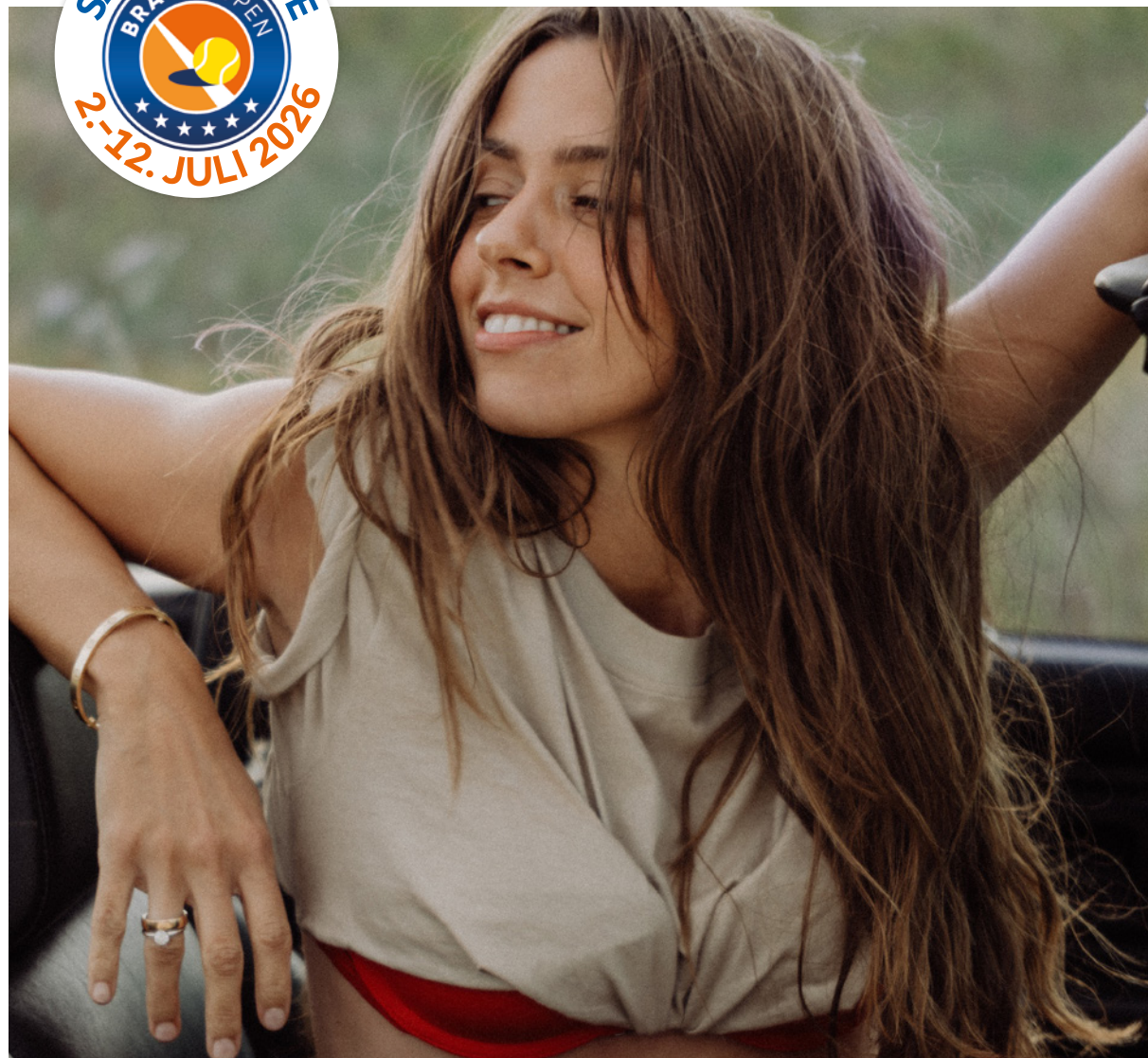
Vanessa Mai berührt und bezaubert das Publikum am 8. Juli mit deutschsprachigen Pop-Schlager.