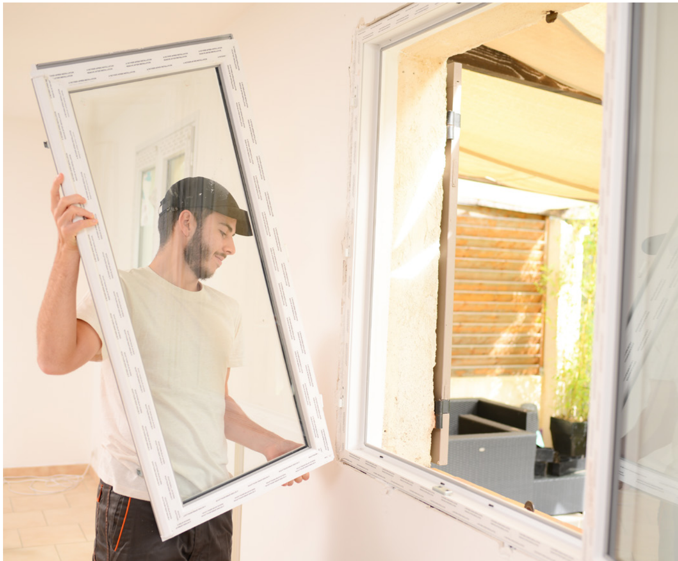
Der Einbau neuer Fenster und Türen steigert sowohl die Sicherheit als auch die Energieeffizienz der eigenen vier Wände.

Lassen Sie sich jetzt beraten von den Experten der Volksbank BRAWO unter volksbank-brawo.de/baufinanzierung .