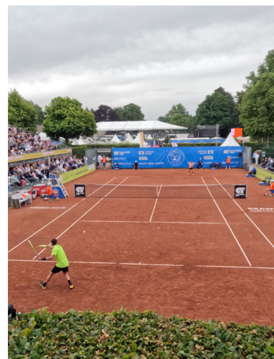
Packende Tennismatches kann man u. a. auf dem BRAWO Center Court erleben.

Weitere Informationen und Tickets sind im Internet unter www.brawo-open.de , www.konzertkasse.de sowie an allen bekannten Vorverkaufsstellen erhältlich. Alle Kunden der Volksbank BRAWO erhalten im Online Banking oder in der Filiale 20 Prozent Ticket-Rabatt.