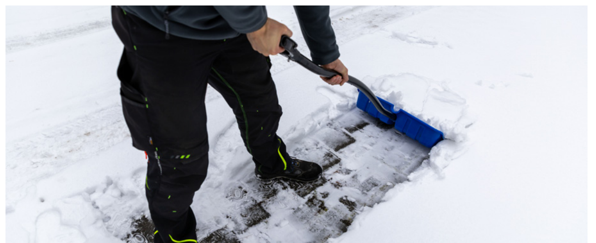
Manchmal lästig, aber notwendig: Schneeschippen – zum Wohle der Gesundheit und Sicherheit der Mitmenschen und des eigenen Geldbeutels.

Alles zur privaten Haftpflichtversicherung und welche Schäden Sie damit finanziell abdecken können, erfahren Sie unter www.volksbank-brawo.de/haftpflicht .