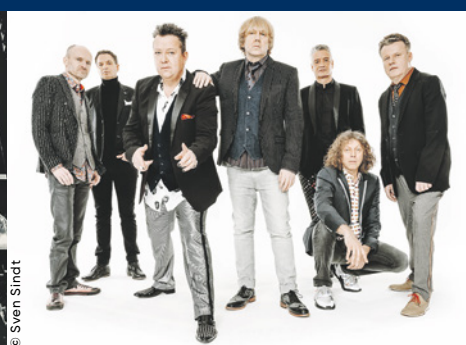
DIE PRINZEN Freitag, 10. Juli