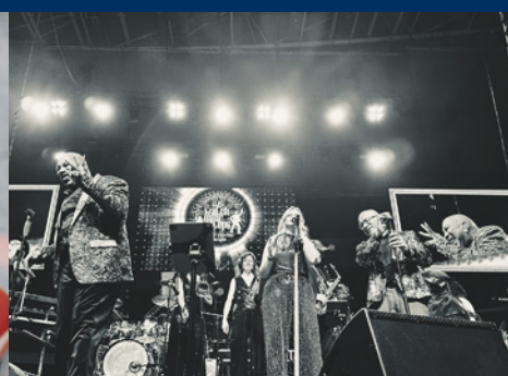
LADIES NIGHT Donnerstag, 9. Juli