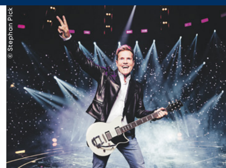
DIETER BOHLEN LIVE MIT BAND Samstag, 11. Juli

Jetzt Tickets sichern! www.brawo-open.de