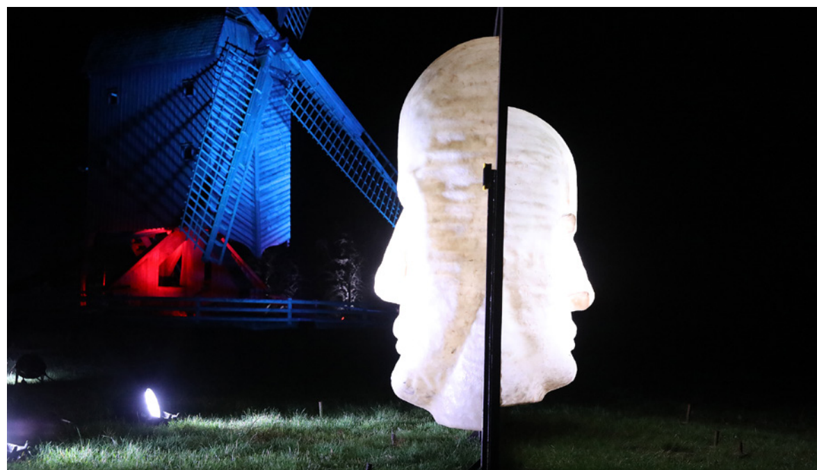
Beeindruckende Lichtinstallation bei den BRAWO Mühlenlichtern 2025.