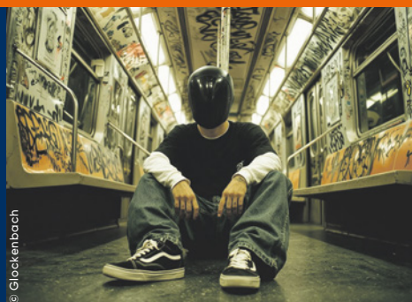
GLOCKENBACH Donnerstag, 2. Juli