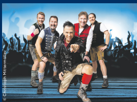
SOMMER WIES'N Dienstag, 7. Juli