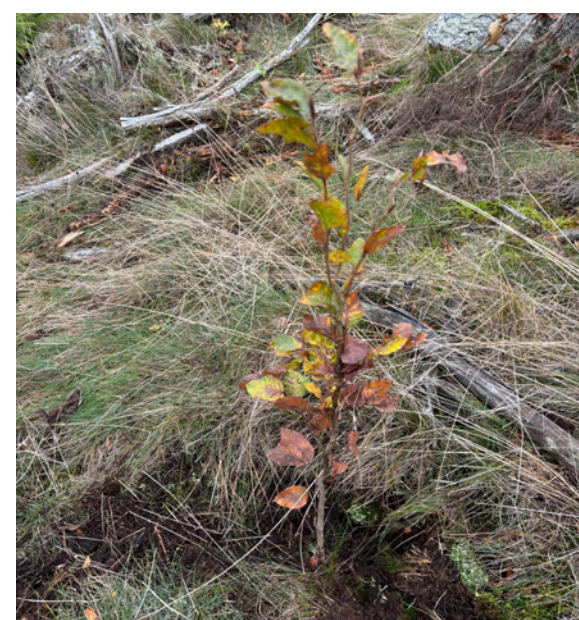
Die neuen Setzlinge heben sich mit ihrer bunten Färbung vom umliegenden Gelände ab.

Wer auch Walddretter werden will, kann jederzeit spenden unter www.harzhelfer.de