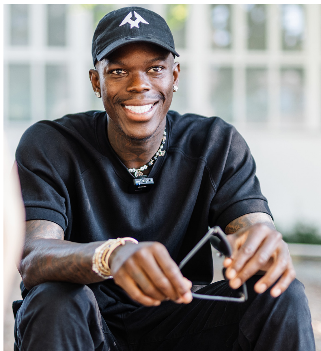
Im Basketball ein Weltstar, Braunschweig im Herzen: Dennis Schröder im Interview.