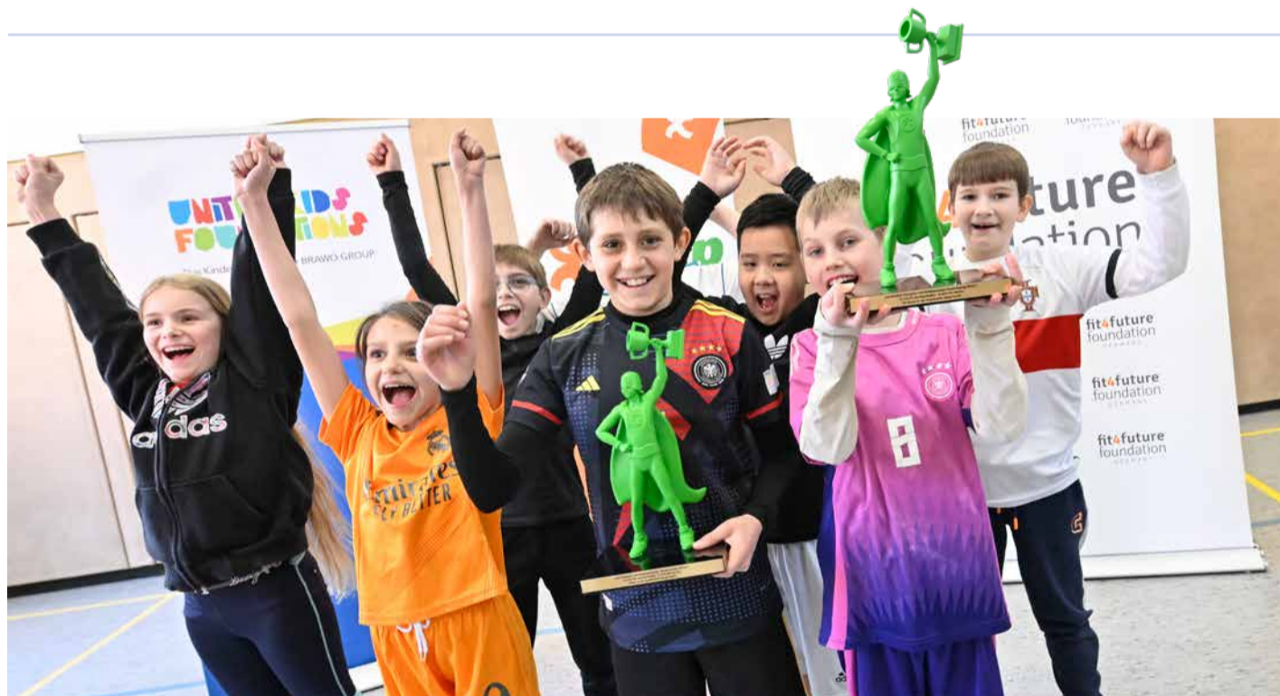
Die Sieger des diesjährigen step-Wettbewerbs bundesweit und in der BRAWO-Region: Die Klasse 4c der Grundschule Bürgerstraße.