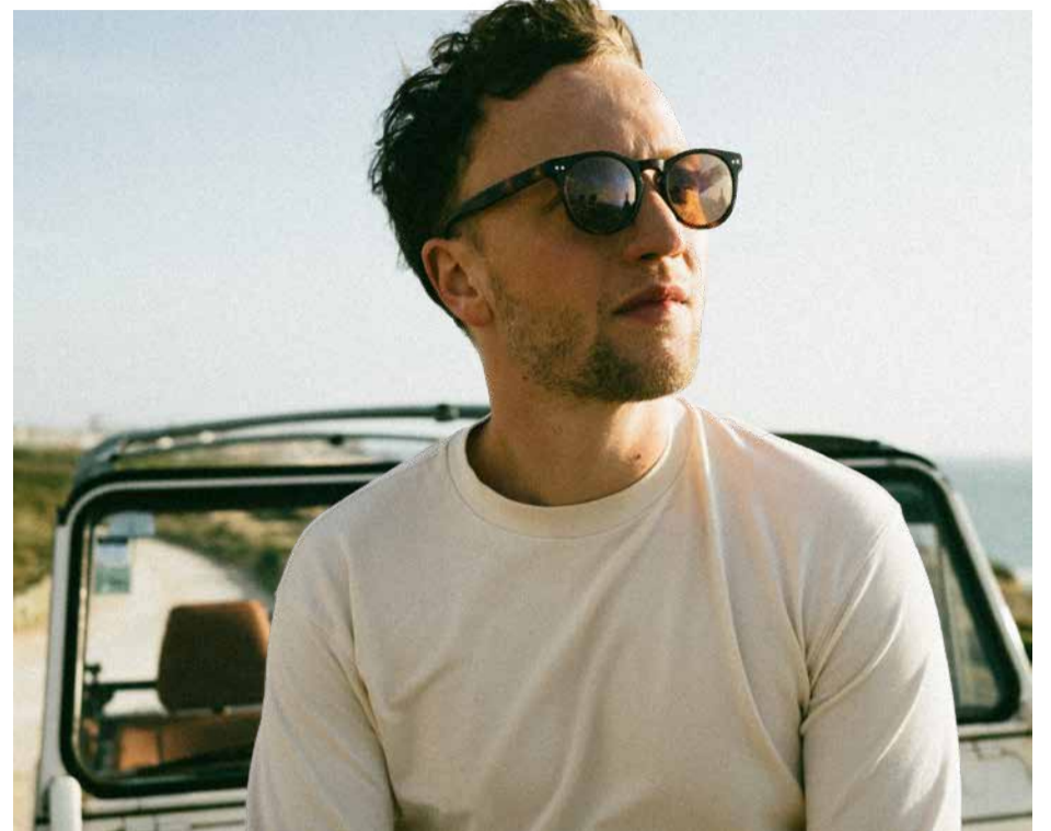
Singer-Songwriter JORIS, bekannt durch seine Teilnahme an der Fernsehreihe „Sing meinen Song – Das Tauschkonzert“, tritt am 4.7.2025 live bei den BRAWO OPEN auf.

Auch im Jahr 2025 behält das Braunschweiger Tennisturnier die Turnierkategorie ATP Challenger