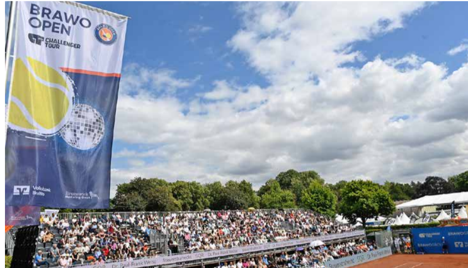
Der Center Court der BRAWO OPEN im Bürgerpark. Hier werden wieder einige der besten Tennisspieler der Welt gegeneinander antreten.